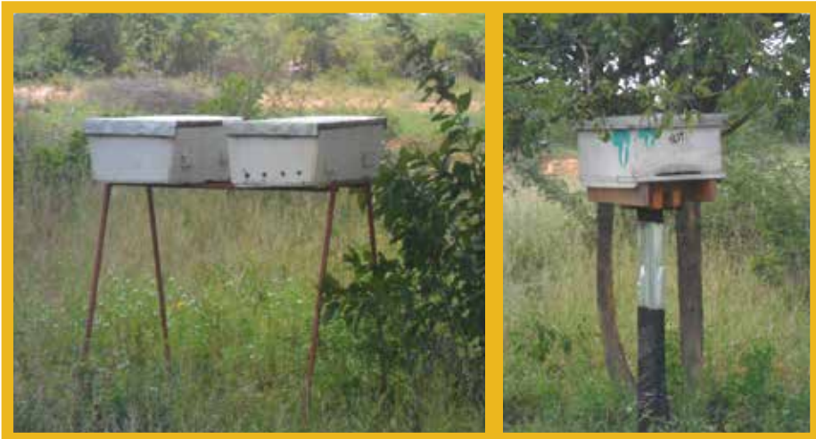
Kielelezo Na. 2: Manzuki ya kichanja cha chuma na kichanja cha mbao