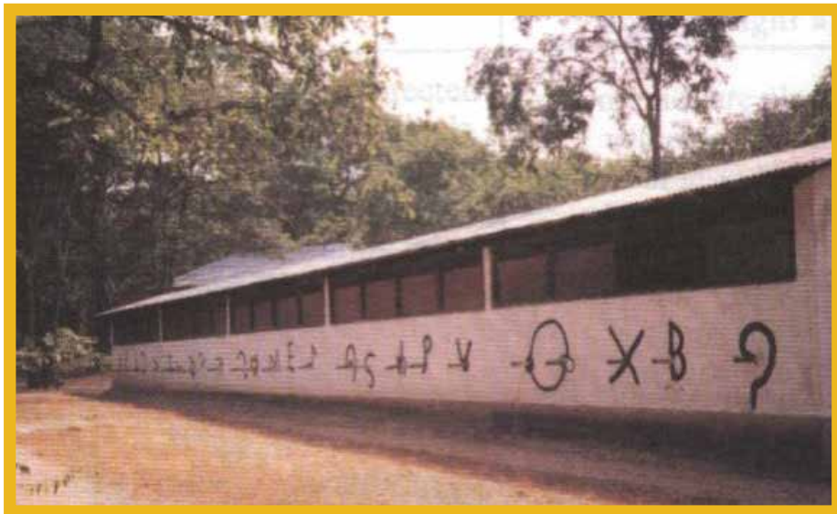
Kielelezo Na. 3: Manzuki ya kwenye Nyumba