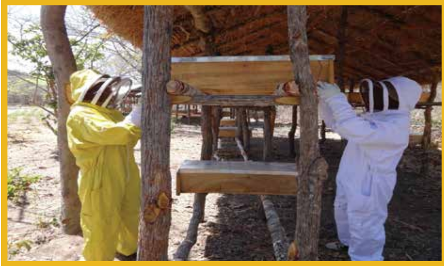
Kielelezo Na. 4: Banda la Nyuki