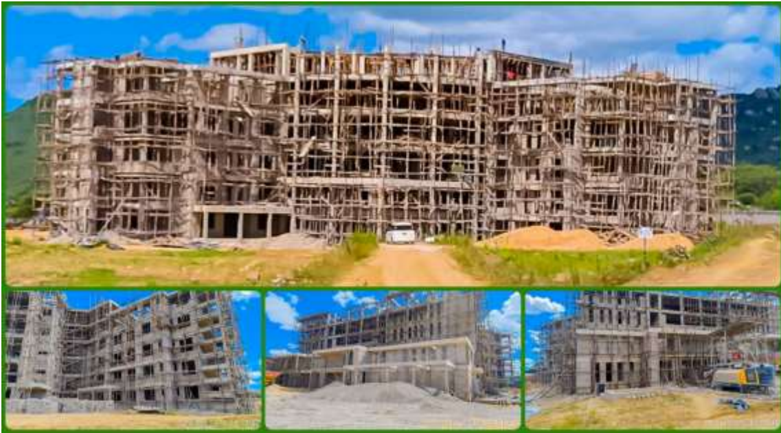
Ujenzi wa jengo la Kituo cha Utangazaji Utalii Kusini mwa Tanzania, Kihesa Kilolo-Iringa.

ukamilishaji wa jengo la Kituo cha Utangazaji Utalii Kusini mwa Tanzania ( Southern Tanzania Destination Marketing Center ) katika eneo la Kihesa Kilolo – Iringa, ambapo ujenzi umefikia asilimia 69.