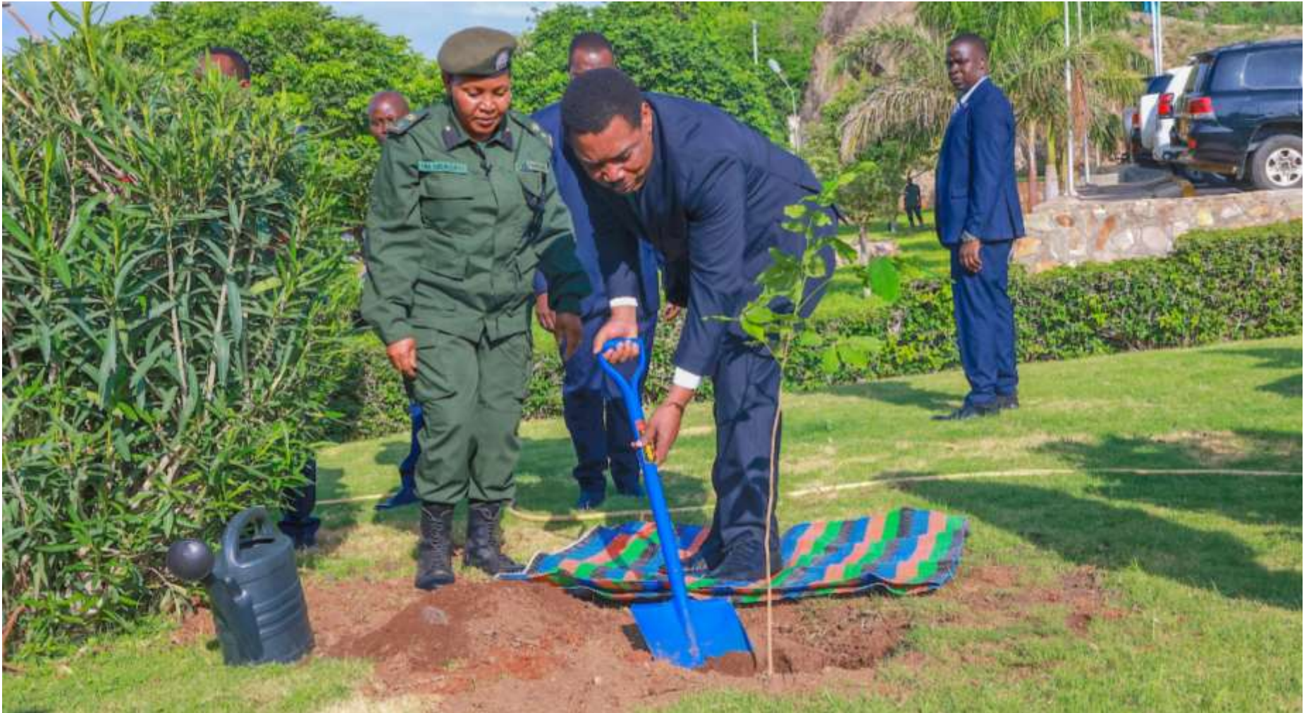
Waziri Mkuu wa Jamhuri ya Muungano wa Tanzania Mhe. Dkt. Mwigulu Lameck Nchemba (Mb.), akipanda mti katika Ofisi ya Waziri Mkuu, Jijini Dodoma, ikiwa ni ishara ya kuadhimisha Kampeni ya 27 ya Kijani.