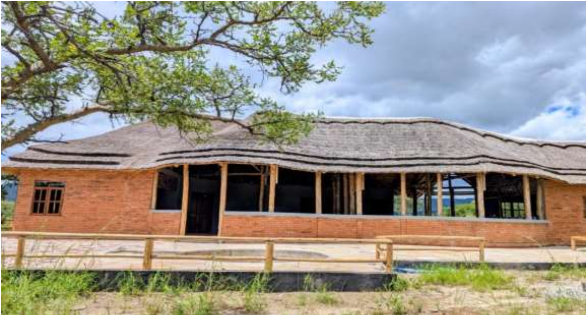
Eneo la kupumzikia wageni (lounge) katika Pori la Akiba Mpanga-Kipengere.

wa wavu, mpira wa kikapu katika Pori la Akiba Pande; na kukarabati eneo la chakula na vinywaji kwa wageni ( lounge ) katika Pori la Akiba Wami-Mbiki.