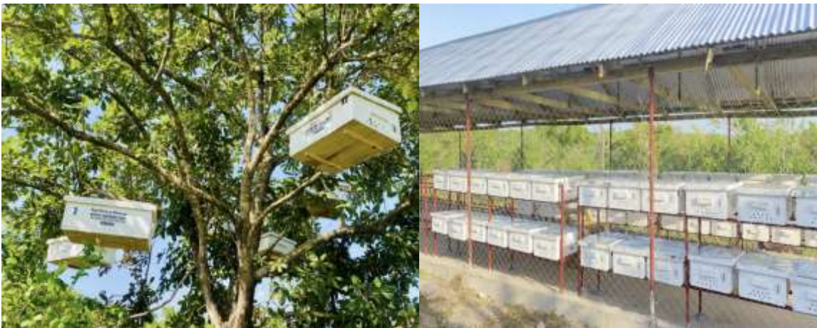
Mizinga ya nyuki ya kisasa iliyowezeshwa na Mfuko wa Msitu Tanzania katika Eneo la Msufini, Kongowe, Kibaha.

153. Mheshimiwa Spika , Mfuko umeendelea kujenga uwezo wa vyuo vya mafunzo ya misitu, viwanda vya misitu na ufugaji nyuki ili kuboresha mazingira ya utoaji elimu kwa kuendelea kuwezesha ujenzi wa bweni la wasichana lenye uwezo wa kuchukua wanafunzi 200 katika Chuo cha Viwanda vya Misitu (FITI) na kuwezesha kuanza kwa ujenzi wa bweni la wanafunzi lenye uwezo wa kuchukua wanafunzi 208 katika Kituo cha Mafunzo ya Misitu na Viwanda vya Misitu (FWITC) kilichopo Mafinga, Iringa. Vilevile, Mfuko umewezesha fedha kwa ajili ya mafunzo ya ufugaji bora wa nyuki kwa vikundi vya wafugaji nyuki 109 vyenye jumla ya wanachama 1,309 ambavyo vimewezeshwa mizinga ya nyuki ya kisasa 3,640 ili kuongeza uzalishaji wa mazao ya nyuki ikiwemo asali na kupunguza utegemezi na uharibifu wa misitu.