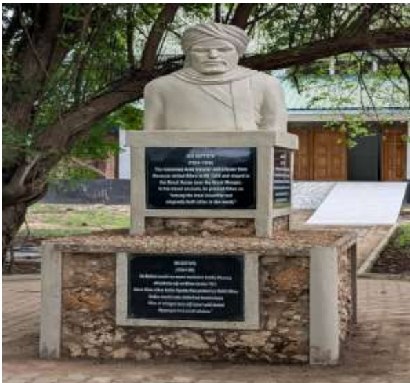
Sanamu ya Ibn Batutta, msomi na msafiri maarufu duniani iliyotengenezwa katika Hifadhi ya Magofu ya Kilwa Kisiwani na Songo Mnara.

Kimataifa ya Dar es Salaam (Sabasaba), Maonesho ya Wakulima (Nanenane), Maonesho ya Biashara ya Kimataifa ya Zanzibar, Nyangumi migration festival , Wiki ya Utalii, Maadhimisho ya Siku ya Wanyamapori Duniani, Maadhimisho ya Siku ya Misitu Duniani na onesho moja (1) la kimataifa la Abu Dhabi International Hunting & Equestrian Exhibition (ADIHEX, 2025) . Sambamba na hilo, Mamlaka iliandaa na kushiriki kampeni 10 za kuhamasisha utalii wa ndani ambazo ni: World Tourism Day, Nyerere Day, Tabora Nyamachoma festival (Tabora zoo), Shangwe la mabingwa wa Yanga na TAWA Sea Cruiser, Kaliua Wildlife Festival, Korosho Marathon (Mtwara), Funga mwaka kijanja na TAWA, University Bash, Siku ya Wanawake Duniani na Shangwe la Valentine na Mishkaki pori . Aidha, katika kuimarisha utalii wa kitamaduni, Mamlaka imejenga sanamu ya Ibn Batutta katika Hifadhi ya Magofu ya Kilwa Kisiwani na Songo Mnara. Batutta anatajwa kuwa msafiri na msomi maarufu aliyesaidia kukuza lugha ya Kiswahili kwenye ukanda wa Pwani ya Afrika Mashariki ambaye alitembelea Mji wa Kilwa ilipo Hifadhi ya Magofu ya Kilwa Kisiwani na Songo Mnara mnamo karne ya 14.