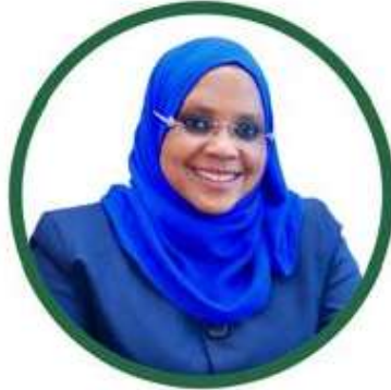
MHE. DKT. ASHATU KIJAJI (Mb.) Waziri wa Maliasili na Utalii