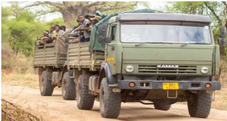
Gari aina ya Kamaz inayotumika katika shughuli za mafunzo kwa vitendo katika Chuo cha Usimamizi wa Wanyamapori, Mweka.

109. Mheshimiwa Spika , katika kuboresha mazingira ya utendaji kazi kwa watumishi pamoja na mazingira ya kujifunzia kwa wanafunzi, Chuo kinaendelea na ujenzi wa darasa moja (1), jiko, vyoo na bafu katika eneo la mafunzo kwa vitendo lililopo katika Kijiji cha Arash, Tarafa ya Loliondo Wilayani Ngorongoro ambapo ujenzi umefikia asilimia 70. Aidha, Chuo kimekarabati nyumba tano (5) za watumishi, vyumba vitano (5) vya madarasa, hosteli nne (4) za wanafunzi na ofisi nane (8) za watumishi. Vilevile, Chuo kimefunga meza 20 na makabati 18 kwenye ofisi za watumishi na kuendelea kuimarisha upatikanaji wa huduma ya mtandao wa intaneti kwa wanafunzi na watumishi. Sambamba na hilo, taratibu za ununuzi wa magari matatu (3) aina ya KAMAZ kwa ajili ya mafunzo kwa vitendo zinaendelea.