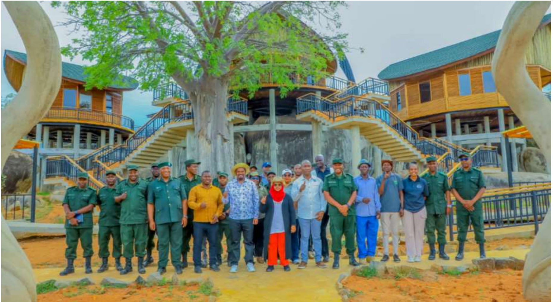
Waziri wa Maliasili na Utalii, Mhe. Dkt. Ashatu Kijaji (Mb.), akiwa na Naibu Waziri, Mhe. Hamad Chande (Mb.), na watendaji wa Wizara baada ya kukagua miradi ya maendeleo Hifadhi ya Taifa Ruaha.