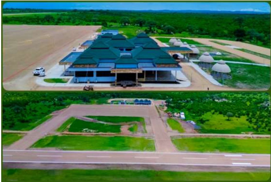
Kiwanja cha ndege katika Hifadhi za Taifa Ruaha

Aidha, jumla ya kilomita 3,757.92 za barabara na kilomita 523.14 za njia za watembea kwa miguu zimejengwa na kukarabatiwa katika maeneo yaliyohifadhiwa ili kurahisisha ufikaji kwenye vivutio vya utalii. Vilevile, miundombinu ya huduma za utalii imeimarishwa kupitia ujenzi wa maeneo sita (6) ya mapumziko kwa wageni na malango tisa (9) ya kuingilia wageni katika Hifadhi za Taifa za Nyerere, Mikumi na Ruaha pamoja na vituo vya utalii katika misitu ya Meru, Vikindu, Mwambesi, Pindirolu, Mlima Rungwe na Ziwa Duluti. Sambamba na hilo, kambi moja (1) ya watalii imejengwa katika Hifadhi ya Misitu ya Mazingira Asilia ya Kilombero.