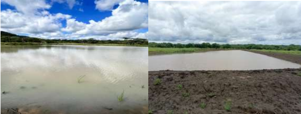
Kushoto ni bwawa la maji katika Pori la Akiba Muhesi na kulia ni bwawa la maji katika Hifadhi ya Wanyamapori Makuyuni

zinaendelea katika Hifadhi ya Taifa Mikumi (1), Mapori ya Akiba Maswa (2), Wami-mbiki (2), Katavi (1) na Selous-Kingupira (1). Juhudi hizo zimeimarisha upatikanaji wa maji kwa wanyamapori ndani ya hifadhi hasa katika kipindi cha kiangazi ambacho wanyamapori hususan tembo wamekuwa wakitoka nje ya hifadhi kutafuta maji na kusababisha madhara kwa wananchi.