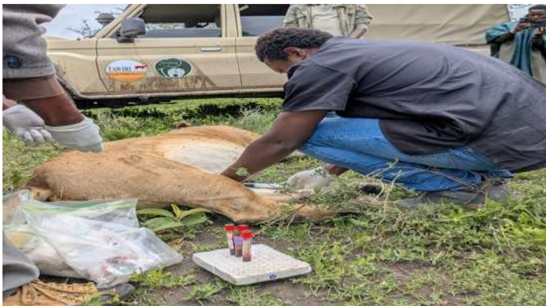
Daktari wa Wanyamapori, akichukua sampuli za damu kutoka kwa simba ikiwa ni sehemu ya ufuatiliaji wa afya za wanyamapori na mifumo ikolojia.

103. Mheshimiwa Spika, Taasisi imeendelea kufuatilia afya za wanyamapori na mifumo ikolojia yote nchini. Zoezi hili ni endelevu na hufanyika ili kubaini mapema uwepo wa magonjwa na kuyadhibiti kabla ya mlipuko na kuhakikisha uhifadhi endelevu, utalii na ustawi wa jamii zinazozunguka maeneo ya hifadhi. Aidha, katika kipindi hiki hakukuwa na ugonjwa ulioripotiwa na hivyo mifumo ikolojia yetu imeendelea kuwa salama.