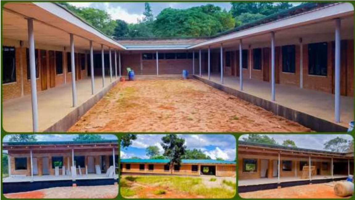
Jengo la bweni la wasichana katika Kituo cha Mafunzo ya Uhifadhi wa Maliasili kwa Jamii - Likuyu Sekamaganga.