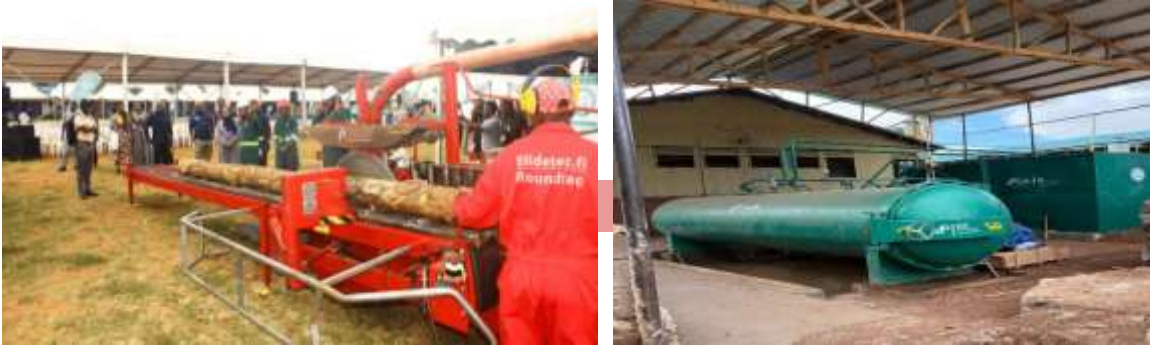
Mashine za kuchakata, kukausha, kutibu na kupima ubora wa mbao.