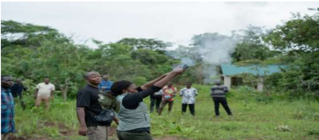
Maaskari wa Vijiji (VGS) wakipatiwa mafunzo ya matumizi sahihi ya kirushio cha mabomu baridi.

100. Mheshimiwa Spika , Katika hatua nyingine, elimu ya kukabiliana na wanyamapori wakali na waharibifu ilitolewa kwa wakufunzi (ToTs) 672 (wanawake 187) katika Wilaya za Mkinga, Korogwe, Same, Mwanga, Babati, Karatu, Meatu, Bunda, Serengeti, Itigi, Manyoni, Iringa Vijijini, Wanging'ombe na Mbarali. Mafunzo hayo yalijikita kwenye mbinu zilizoboreshwa na zenye ufanisi mkubwa zikiwemo matumizi ya mipira (noise ball) inayotoa milio mbalimbali inayoweza kuwafukuza tembo, matumizi sahihi ya vilipuzi na virushio vyake na uzio unaotoa milio na mwanga tofauti kulinda maghala ya mazao; vyanzo vya maji; na mazizi ya mifugo. Wakufunzi hao wataendelea kuelimisha jamii kwenye maeneo yao jambo ambalo litapunguza kadhia inayotokana na migongano baina ya binadamu na wanyamapori. Pia Taasisi ilitoa mafunzo ya njia bora za ufugaji nyuki na uboreshaji wa thamani wa mazao yatokanayo na nyuki kwa wadau 499 (wanawake 182) wa Jijini Arusha na maeneo ya jirani ya Wilaya za Ngorongoro na Kiteto. Lengo kuu ni kuongeza jitihada za Serikali katika kuimarisha mnyororo wa thamani na kuinua vipato vya wananchi.