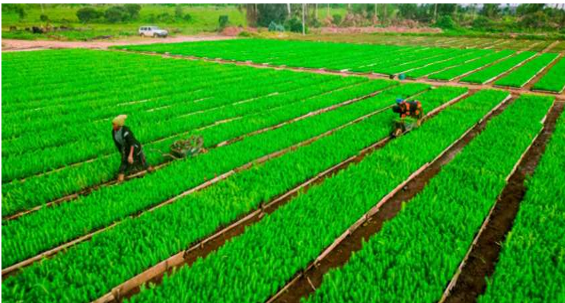
Kitalu cha miche ya miti aina ya msindano (Pines) katika Shamba la Miti Sao Hill, Iringa.

135. Mheshimiwa Spika , katika kuendeleza mashamba ya miti, Wakala umepanda miti katika eneo lenye ukubwa wa hekta 9,558; kurudishia miti iliyokufa kwenye eneo la hekta 1,925; kupalilia eneo lenye hekta 25,633.33; kupogolea hekta 9,239; na kupunguzia miti kwenye hekta 8,512 katika mashamba yanayosimamiwa na Wakala. Aidha, Wakala umepanda miche ya mikoko 45,000 kwenye eneo lenye ukubwa wa hekta 42.2 katika mwambao wa Bahari ya Hindi katika wilaya za Temeke, Tanga na Lindi. Vilevile, Wakala kwa kushirikiana na wadau wakiwemo Earthlungs , WWF na WIOMN umepanda jumla ya miche ya mikoko 37,253,952 katika Mikoa ya Tanga na Pwani.