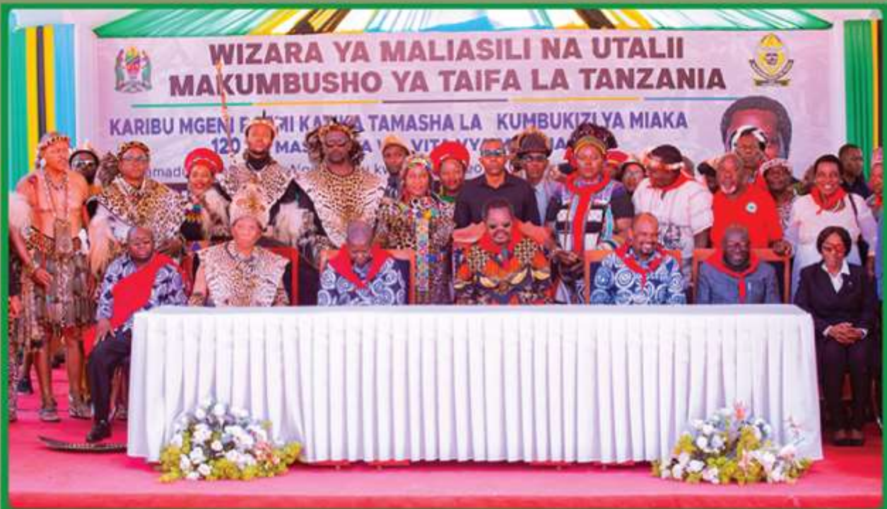
Makamu wa Rais, Mhe. Balozi Dkt. Emmanuel Nchimbi akiwa katika picha ya pamoja na Machifu wa kabila la Kingoni katika kilele cha Maadhimisho ya wiki ya Mashujaa wa vita vya Majimaji katika eneo la kumbukumbu ya Mashujaa wa Vita vya Majimaji Mjini Songea Mkoani Ruvuma.