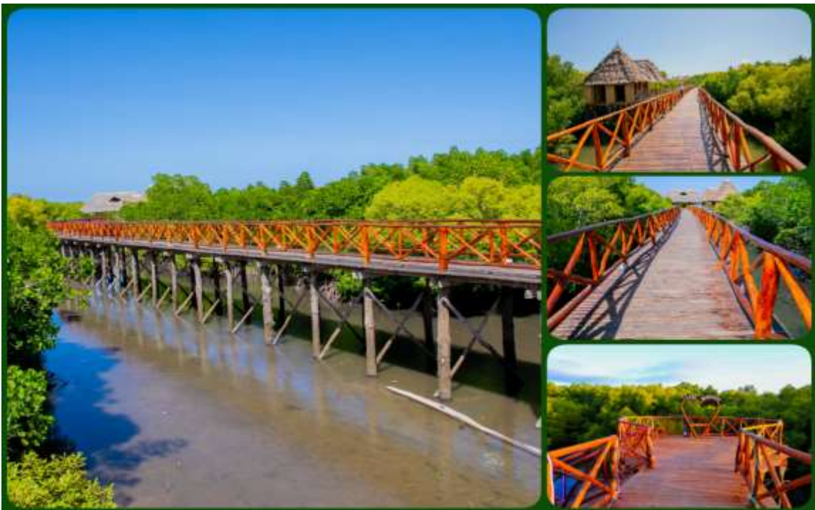
Mradi wa Ujenzi wa Daraja la Watembea kwa Miguu (Board Walk) katika Hifadhi ya Misitu ya Mikoko Sahare, Tanga.

Mazingira Asilia Amani); mabanda sita (6) ya kupumzikia watalii katika Misitu ya Mazingira Asilia Rau (5) na Matogoro (1); jiko moja (1) na vyoo viwili katika Misitu ya Mazingira Asilia Nilo na Chome. Aidha, Wakala umekarabati kilomita 287.14 za njia za watembea kwa miguu katika hifadhi za misitu 24; kilomita 41.32 za barabara za msituni katika hifadhi za Kilombero, Kalambo na Mlima Rungwe; kilomita 8.6 za barabara za kufika katika hifadhi za Pindi na Matogoro; na kilomita 48 za barabara za mashindano ya magari katika hifadhi za Pugu Kazimzumbwi, Vikindu, Amani, Nilo na Rau. Vilevile, Wakala umekarabati kambi nane (8) za watalii katika hifadhi za misitu za Magamba (2), Kilombero (2), Amani (3) na Rau (1). Sambamba na hilo, Wakala umekarabati mnara mmoja (1) wa kutazama vivutio katika Hifadhi ya Msitu Magamba.