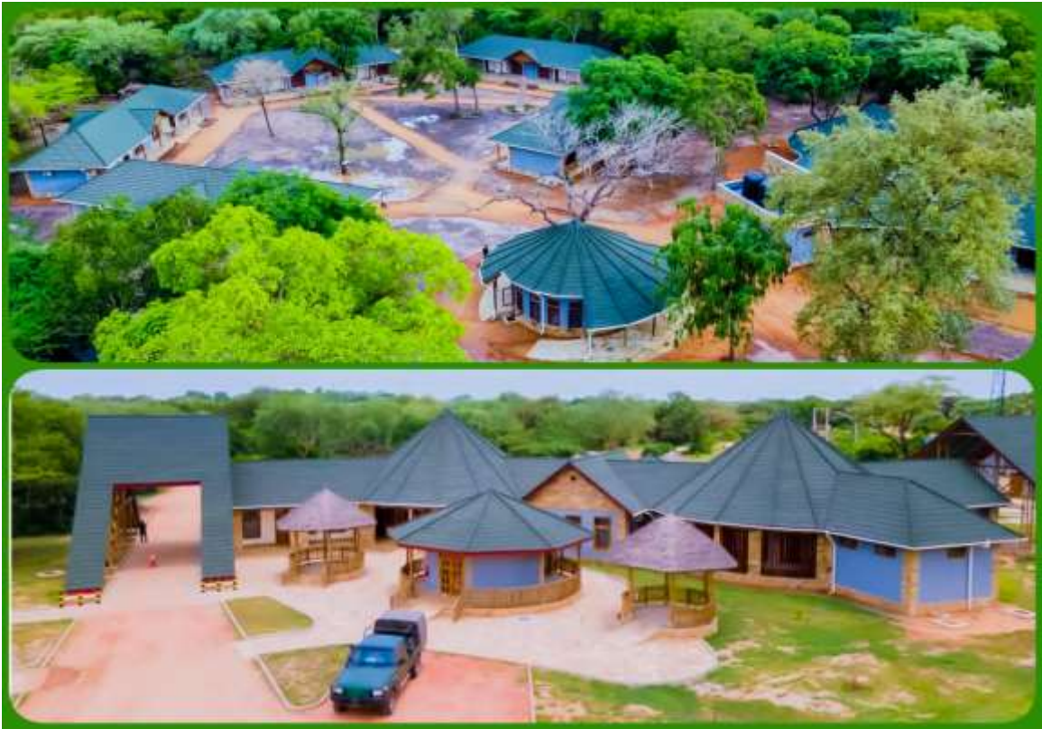
Miundombinu ya Utalii katika Hifadhi ya Taifa Nyerere

Uwekezaji huu umeleta matokeo chanya yanayoonekana kwa kuongeza urahisi wa kufikia vivutio vya utalii, kuboresha uzoefu wa wageni na kufungua fursa za ajira na biashara kwa wananchi wanaoishi jirani na maeneo ya hifadhi. Aidha, umechangia ongezeko la mapato ya Serikali na ukuaji wa sekta kwa ujumla. Mathalan, katika Ukanda wa Kusini, maboresho haya yamewezesha ongezeko la watalii kutoka 197,402 hadi kufikia 205,520 na mapato kuongezeka kutoka Shilingi bilioni 24.6 hadi bilioni 27.7 katika kipindi cha Julai 2025 hadi Aprili, 2026. Mafanikio haya yanaakisi dhamira ya Serikali ya kuendelea kuimarisha miundombinu ya utalii ili kuongeza ushindani wa Tanzania kimataifa, kuchochea ukuaji wa uchumi na kuboresha ustawi wa wananchi.