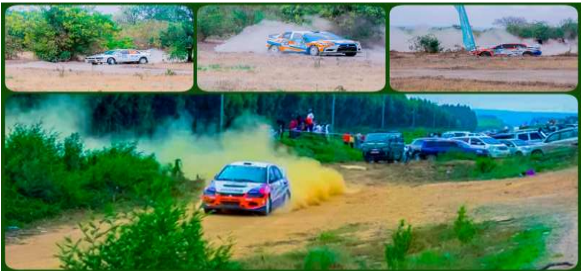
Mashindano ya Magari katika Shamba la Miti Morogoro, Eneo la Makunganya na Shamba la Miti Sao Hill, Iringa.

137. Mheshimiwa Spika, katika kuimarisha utangazaji wa vivutio vya utalii ikolojia na malikale, Wakala umezalisha na kurusha vipindi 19 vya redio na 38 vya televisheni pamoja na kusambaza machapisho 8,859. Aidha, Wakala uliandaa na kushiriki matamasha 15 ya ndani kwa ajili ya kutangaza utalii ambayo ni: - Mt. Hanang Nyama Choma Festival, Tukacharu Rau Forest, The Epic Nyama Choma, Meru Adventure Race, Rubare Trail Run, Mkwawa Rally, Rombo Marathon, Ndafu Festival, Magamba Walkthon, Kalambo Waterfalls Utalii Festival, Twendezetu Lake Ngosi, Itulu Hill Staff Tour, West Kill Tour Challenge, Tukutane Mt. Rungwe Season II na Uni Pugu Easter Experience.