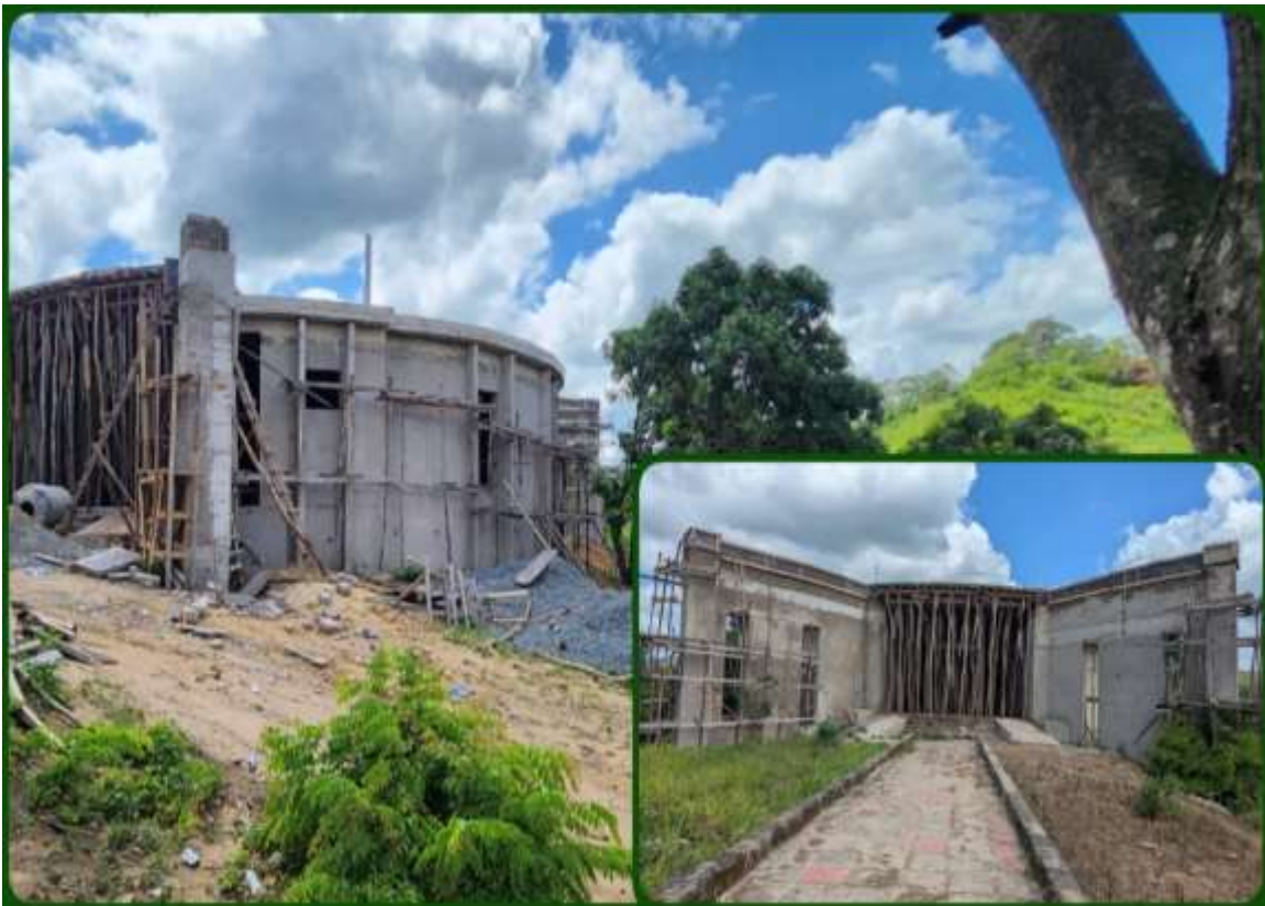
Ujenzi wa Jengo la Kituo cha Kumbukumbu ya Vita vya Majimaji - Nandete, Kilwa.

Wananchi wa Tanzania limekamilisha Ujenzi wa Kituo cha Kumbukumbu na Taarifa kilichopo Songea katika eneo ambalo mashujaa 67 wa vita vya Majimaji walinyongwa. Kituo hicho kinatumiwa na Baraza la Mila na Desturi za Mkoa wa Ruvuma kwa ajili ya kufungamanisha utalii wa malikale na utamaduni. Vilevile, kazi ya uboreshaji wa Sanamu 12 za mashujaa wa vita vya Majimaji zilizopo katika viwanja vya Makumbusho ya Majimaji, Songea unaendelea ambapo kukamilika kwake kutatoa tafsiri halisi ya taswira za mashujaa hao na mchango wao katika kuasisi ukombozi wa Taifa la Tanzania.