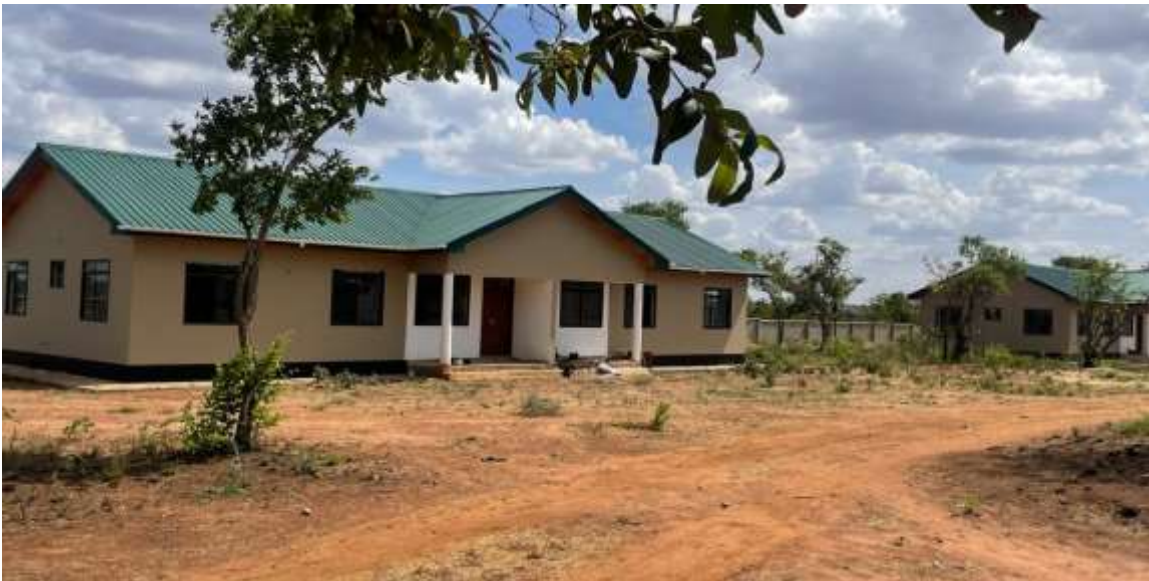
Moja ya nyumba za watumishi 2 in 1 zilizojengwa katika hifadhi ya Taifa Tarangire.

74. Mheshimiwa Spika , katika kuboresha utendaji kazi kwa watumishi, Shirika limejenga nyumba za watumishi 15 katika Hifadhi za Taifa Ibanda-Kyerwa (5), Serengeti (5) na Tarangire (5). Vilevile, limekarabati nyumba za watumishi 118 zilizopo ndani ya hifadhi za Taifa ili kuwezesha watumishi kuongeza morali ya ufanyaji kazi. Ukarabati huu umefanyika katika hifadhi za Taifa Ibanda-Kyerwa (1), Milima ya Mahale (36), Mkomazi (1), Nyerere (62), Ruaha (5), Rumanyika-Karagwe (1), Serengeti (1), Tarangire (2), Milima ya Udzungwa (7) na Kitulo (2)