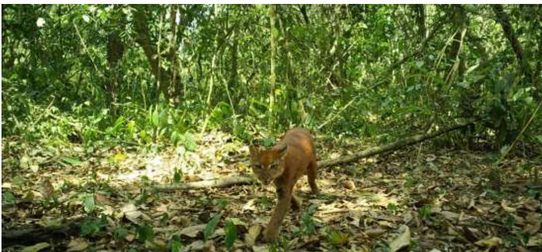
Picha ya paka wa dhahabu (African Golden Cat) katika msitu wa Minziro wilaya ya Misenyi mkoani Kagera.

wanyamapori, usimamizi wa utalii na migongano baina ya binadamu na wanyamapori wakali na waharibifu katika maeneo mbalimbali nchini. Tafiti hizo zimechangia upatikanaji wa taarifa muhimu za kufundishia, mbinu za utatuzi wa migongano baina ya binadamu na wanyamapori wakali na waharibifu katika jamii inayozunguka maeneo yaliyohifadhiwa, kupambana na ujangili pamoja na kuendeleza shughuli za uhifadhi na utalii nchini. Baadhi ya tafiti zilizofanyika ni pamoja na Ufuatiliaji wa wanyamapori; maisha na ikolojia ya paka wa dhahabu (African golden cat) aliyegundulika nchini mwaka 2019 katika msitu wa Minziro Mkoani Kagera anayepatikana katika nchi za bonde la ufa la Albertine; tathmini ya maeneo mbadala ya kuhifadhi kobe chapati (pancake tortoise) kaskazini mwa Tanzania; na utafiti juu ya changamoto za ufanisi wa usimamizi shirikishi wa maeneo ya Jumuiya za Wanyamapori Nchini. Aidha, kupitia tafiti hizo wataalam wameweza kutoa machapisho 15 katika majarida ya kisayansi ya kimataifa pamoja na kuhudhuria na kutoa mada katika makongamano ya kisayansi ndani na nje ya nchi.