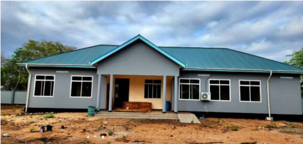
Jengo la Ofisi katika Pori la Akiba Kilombero.

83. Mheshimiwa Spika , katika kuongeza nguvu kazi na ufanisi katika kutekeleza majukumu, Mamlaka imeajiri askari 551 wa ajira ya kudumu ambapo kati yao, askari 256 wamekamilisha mafunzo ya ukakamavu na kupangiwa vituo vya kazi na 295 wanaendelea na mafunzo ya ukakamavu na utayari.