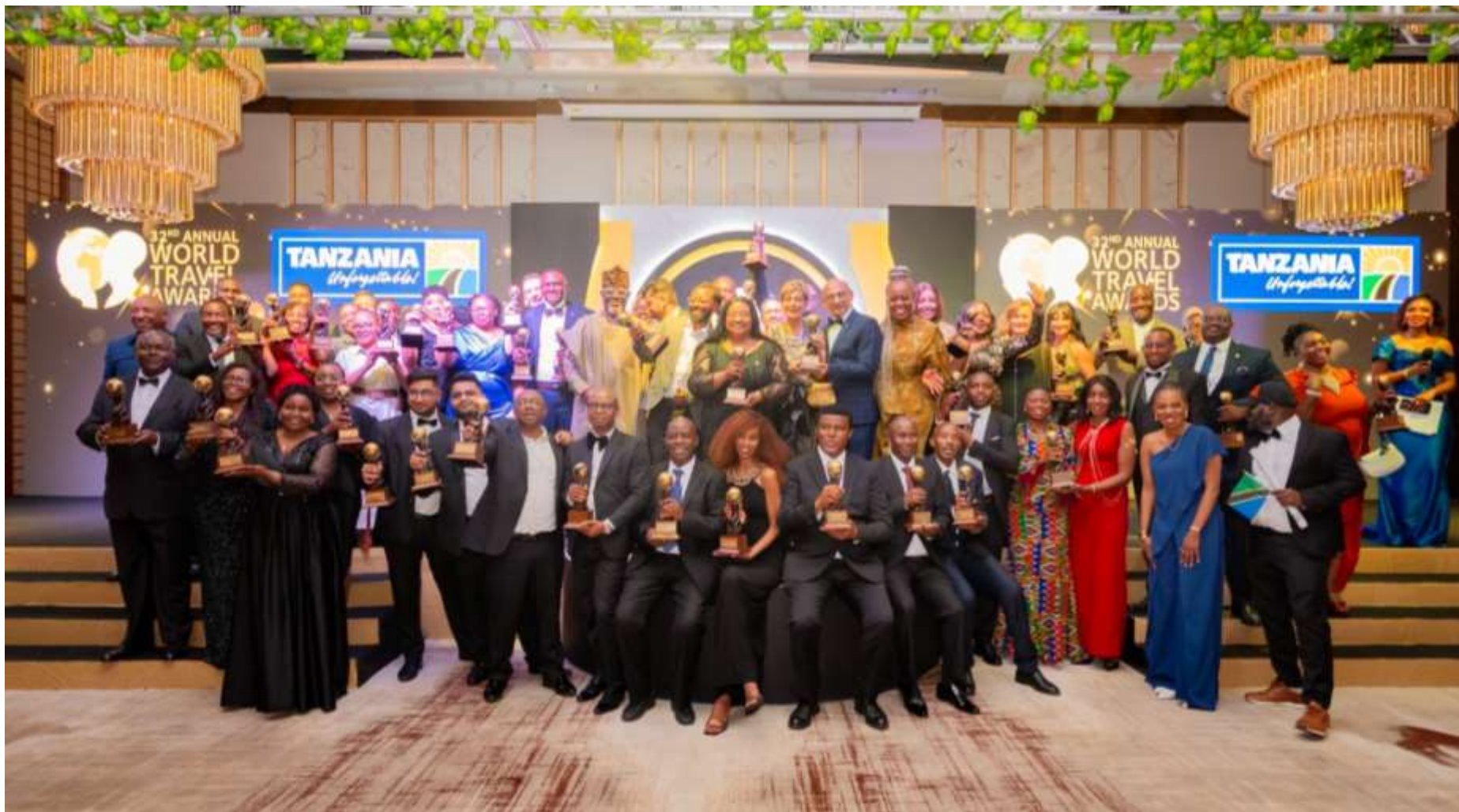
Washindi wa tuzo za World Travel Awards Africa katika picha ya pamoja baada ya kutangazwa katika Ukumbi wa Johari Rotana, Jijini Dar es Salaam.