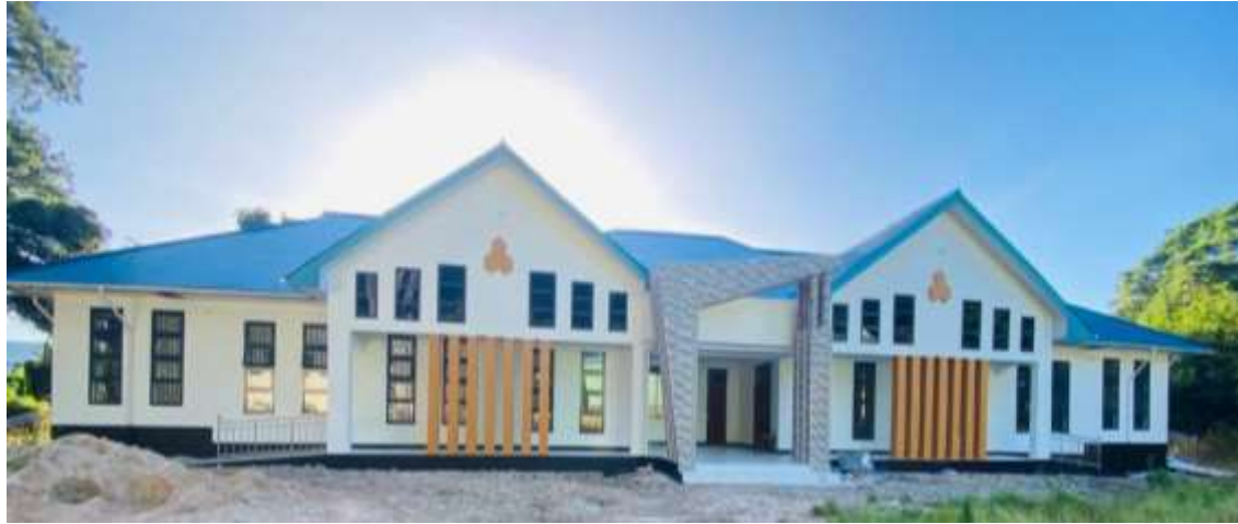
Jengo la Mihadhara katika Chuo cha Mafunzo ya Ufugaji Nyuki Tabora - BTI.

mradi huo, mafunzo yametolewa kwa wafugaji wa nyuki 156 katika wilaya za Kaliua na Urambo na mizinga ya nyuki 500 imegawiwa.