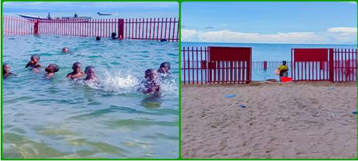
Vizimba vya Kuzuia mamba na viboko vilivyojengwa katika Wilaya ya Nyasa.

44. Mheshimiwa Spika, Wizara kupitia taasisi zake imeendelea kuimarisha matumizi ya teknolojia katika kukabiliana na wanyamapori wakali na waharibifu kwa kufuatilia mienendo yao na kuwadhibiti. Katika kutekeleza hilo, Wizara kwa kushirikiana na wadau, imefunga visukuma mawimbi kwa wanyamapori 76 kati ya 50 vilivyopangwa kufungwa sawa na asilimia 152 kwa makundi mbalimbali wakiwemo tembo viongozi 51 katika Halmashauri za wilaya za Karagwe, Misenyi, Itigi, Manyoni, Ikungi, Singida, Same, Korogwe, Handeni, Kondo, Chamwino, Iringa, Morogoro, Mvomero na Chalinze na kufanya tembo viongozi waliofungwa visukuma mawimbi nchini kufikia 205; simba 20 katika Hifadhi za Taifa Nyerere (3), Ruaha (8), Serengeti (7) na Pori la Akiba Maswa (2); mbwamwitu (4) katika Pori la Akiba Selous; na chui mmoja (1) katika Eneo la Hifadhi ya Ngorongoro. Matumizi ya teknolojia hiyo yameongeza ufanisi katika ufuatiliaji wa mienendo ya wanyamapori kwa wakati na kuchukua hatua za haraka kabla ya kusababisha madhara. Vilevile, matumizi ya ndege nyuki 59 zilizonunuliwa na Wizara kwa kushirikiana na wadau yameboresha uwezo