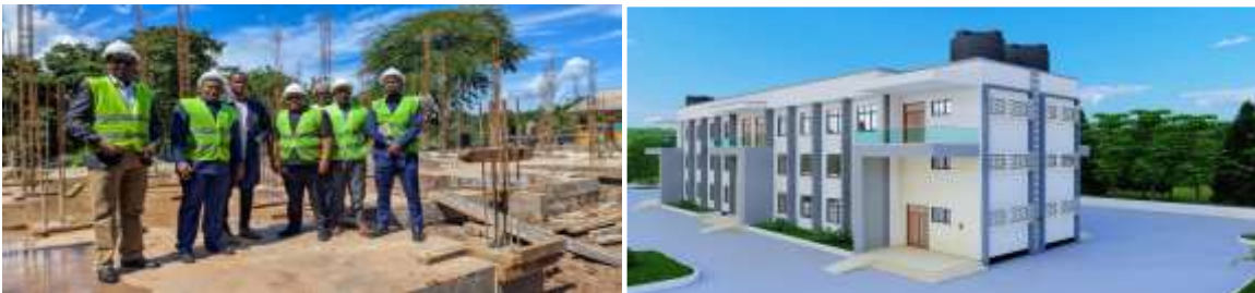
Kushoto ni Wajumbe wa Bodi wakikagua kuanza kwa ujenzi wa bweni la wasichana chini ya ufadhili wa TaFF Kulia ni Muonekano wa Jengo la Bweni la wasichana litakapokamilika.

162. Mheshimiwa Spika, katika kuimarisha utendaji kazi, Chuo kimwezesha watumishi wanne (4) kupata mafunzo ya muda mrefu, wawili (2) ndani ya nchi na wengine wawili (2) nje ya nchi. Watumishi 33 wamepata mafunzo ya muda mfupi katika fani za ufundishaji, masuala ya kijinsia na maadili. Aidha, Chuo kimeendelea kutangaza huduma zake katika maonyesho na makongamano mbalimbali ndani na nje ya nchi ikiwa ni pamoja na mitandao ya kijamii na vyombo vya habari. Vilevile, kupitia mradi wa kukuza ujuzi unaofadhiliwa na Jumuiya ya Umoja wa Ulaya, Chuo kimeratibu na kuendesha warsha iliolenga kuboresha mitaala ya ufundi stadi wa misitu na viwanda vya misitu kwa nchi za Tanzania na Zambia.